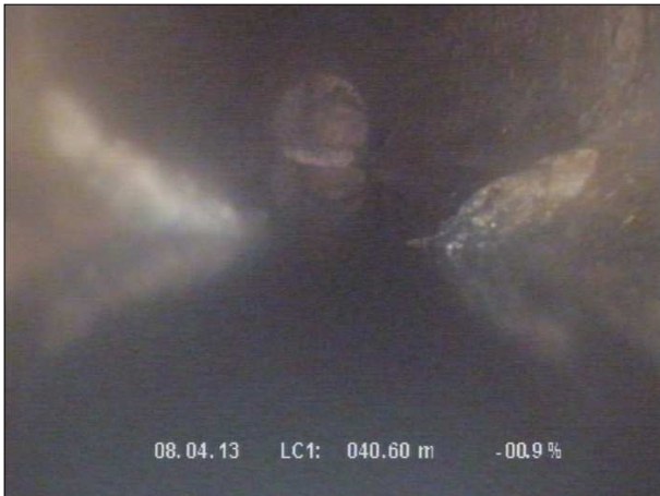
Fotografía: 54_2a 40,5m, En todo el tramo inspeccionado, las juntas tiene hormigón en su interior