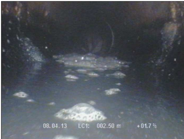
Fotografía: 48_2a 2,5m, Junta con hormigón interior desde 04 hasta 08 horas