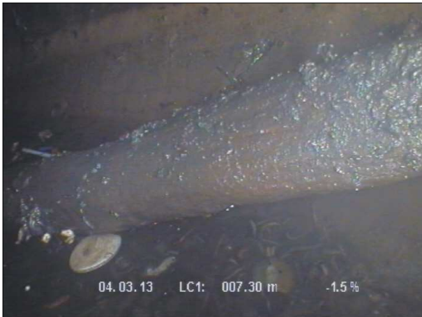
Fotografía: 42_2a 7,6m, Existe una raíz gruesa a lo largo del tubo