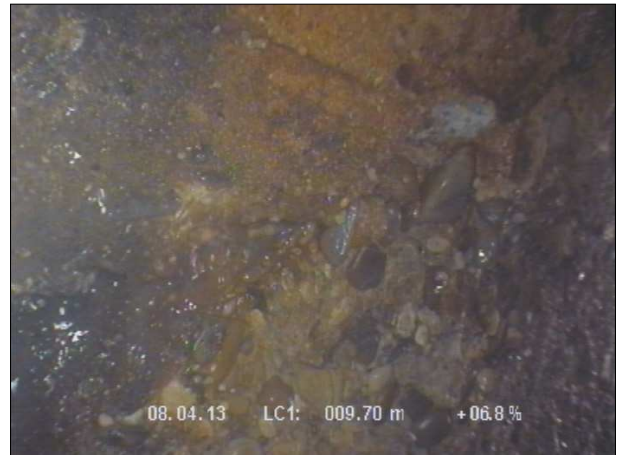
Fotografía: 55_3a 44m, Fin de la inspección en pozo 5, situado dentro del jardín. A éste salen 4 sumideros. Hay una filtración de agua