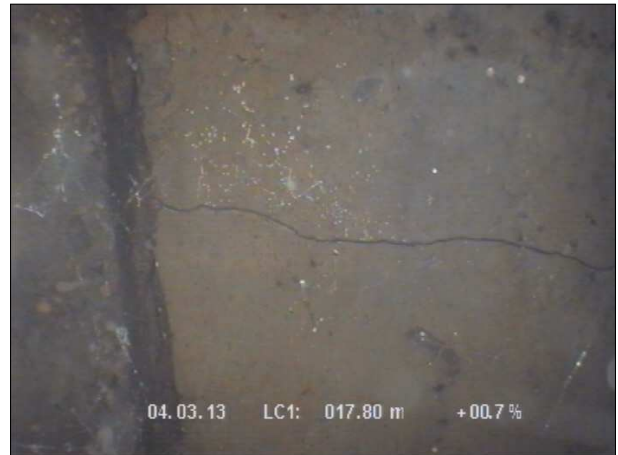
Fotografía: 44_4a 17,8m, Grieta en la junta a las 12 horas. Anchura 1 cm