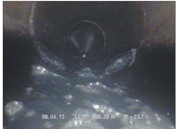
Fotografía: 49_3a 5,1m, Junta con hormigón interior desde 05 hasta 07 horas