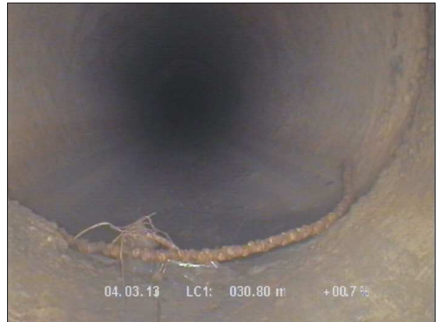
Fotografía: 39_3a 30,8m, Junta abierta desde 06 hasta 07 horas, con raíces