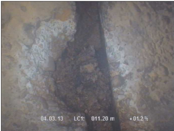
Fotografía: 38_2a 11,2m, Roturas. Faltan trozos en la junta a las 08 horas