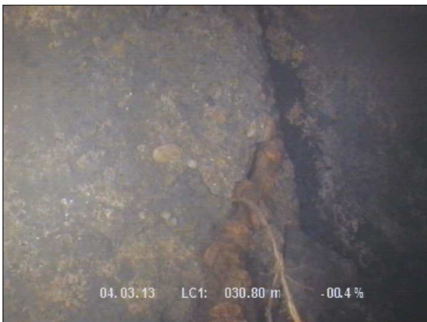
Fotografía: 39_3b 30,8m, Junta abierta desde 06 hasta 07 horas, con raíces