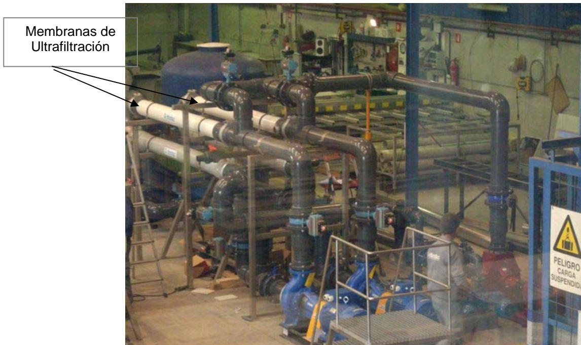
Membranas de Ultrafiltración