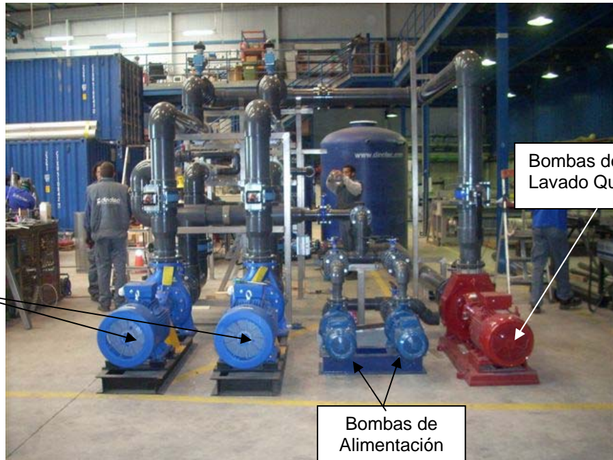
Módulo completo de Ultrafiltración.